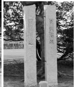
結城豊太郎蔵相揮毫 国旗掲揚台モニュメント