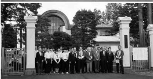
除幕式（上・除幕 下・出席者）（9/5）