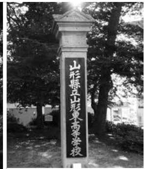
旧門柱復元モニュメント