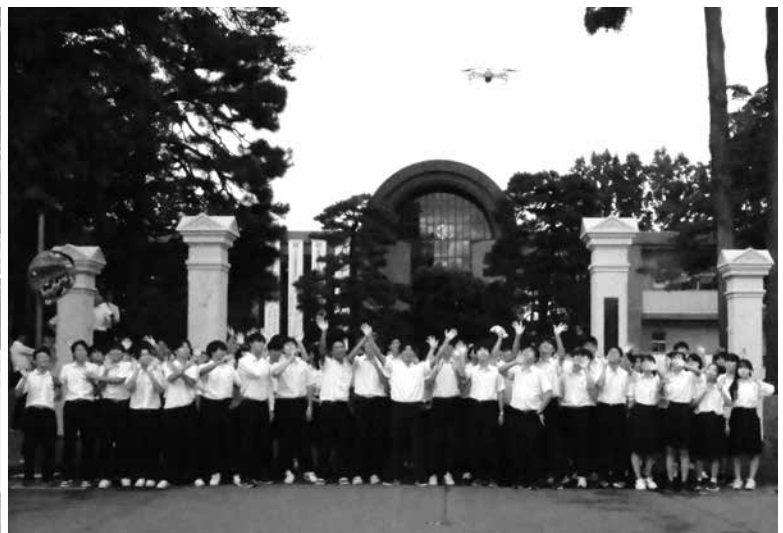
新正門完成を祝う全校生徒記念撮影（9/12）