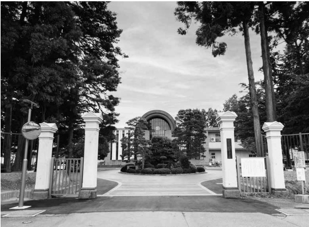
創立140周年記念事業（復元された新正門と周辺整備）