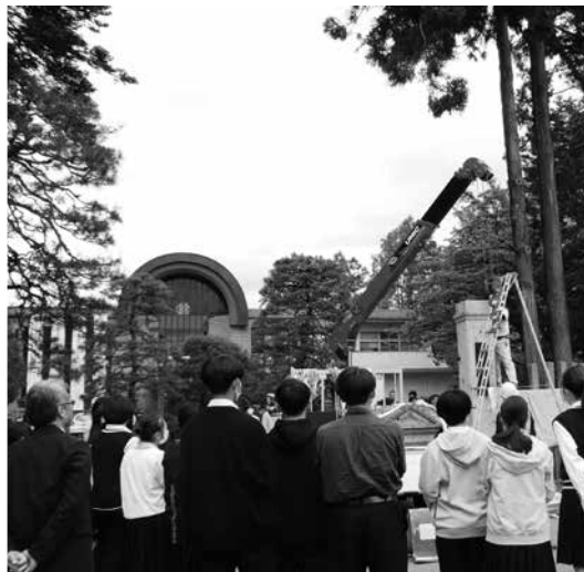
生徒も見守る中、正柱の撤去作業（5/8）