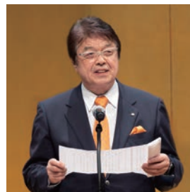
記念式典において

山形県唯一の中学校として明治17年創設された母校は、幾多の変遷を重ね、幾多の困難を乗り越え、令和6年10月29日に創立140周年を迎えました。大変な慶事であり、まことに喜びに耐えないところです。