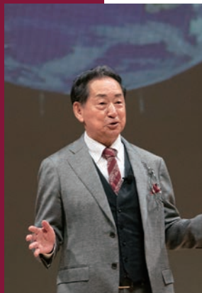
記念講演会において 講師 元宇布飛行士、全国科学館連携協議会会長 毛利 衛氏